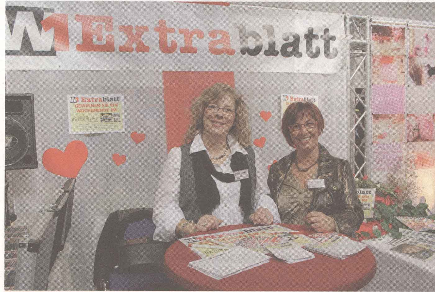
Das W1 Extrablatt war nur einer der zahlreichen Aussteller bei der Wormser Hochzeitsmesse